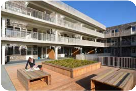
Binnenhof Een plek voor ontmoeting