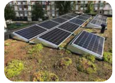
Duurzaamheid Gedacht wordt o.a. aan: Warmtenet Grijswatercircuit PV-panelen Vegetatiedaken Duurzame materialen