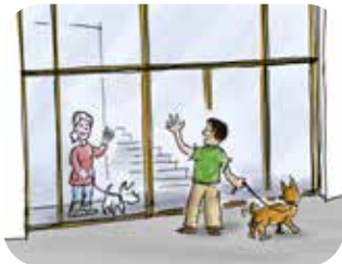
Interactie Ontmoetingen tussen buurtbewoners stimuleren