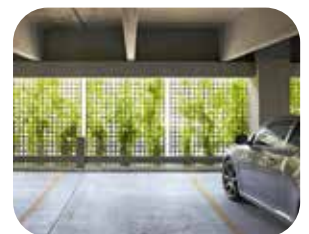
Parkeren in de plint De uitstraling van de plint van het gebouw krijgt extra aandacht