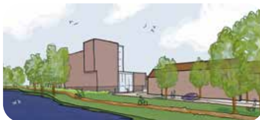
1. Robuust met een klein hoekaccent

Het gebouw zoekt aan de oostzijde aansluiting met de schaal van de buurt. Aan de westzijde kan het gebouw meer hoogte krijgen. Onderzocht wordt hoe deze zijde optimaal kan worden vormgegeven