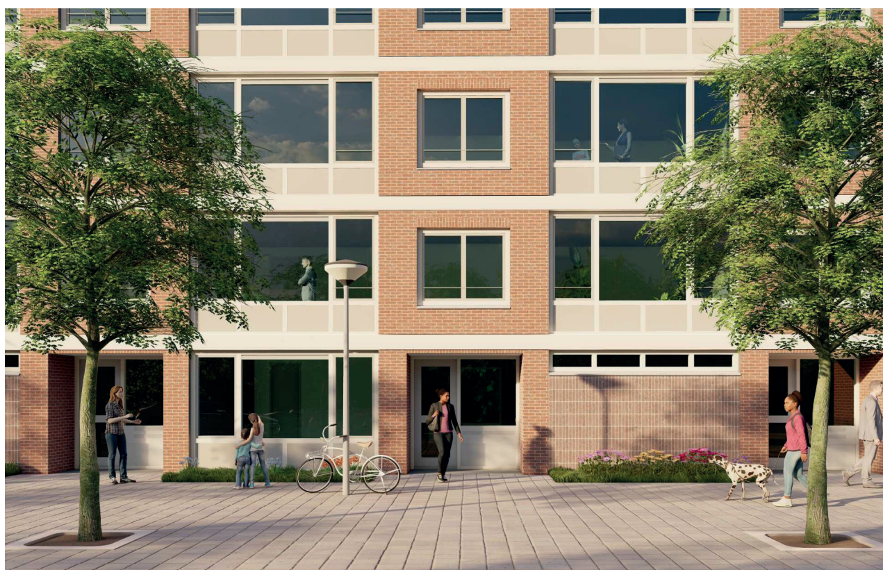
Impressie buitengevel voorkant