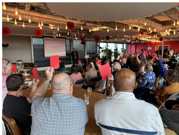
De deelnemers geven hun mening over hun invloed

Aan de ronde-tafel-gesprekken werd vervolgens de discussie gevoerd hoe iedereen een bijdrage kan leveren aan de nieuwe huurdersorganisatie en wat